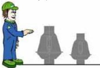
Вентиляторы CRDV 200 - 315